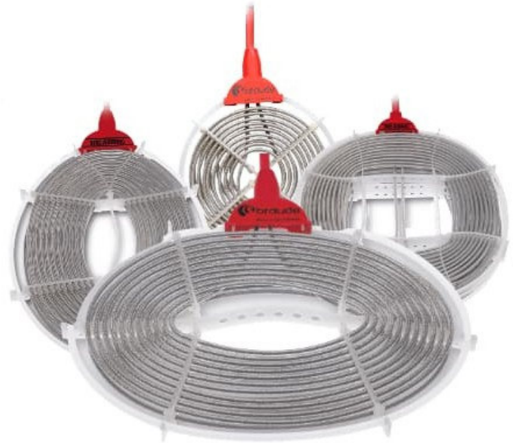
Polaris Popular range

Ohřivač je dostatečně tenký, aby se snadno vešel do stísněných prostor, např. za anodové koše.